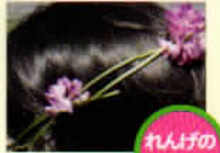
れんげのかんむり