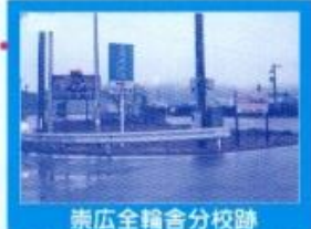
崇広全輪舎分校跡