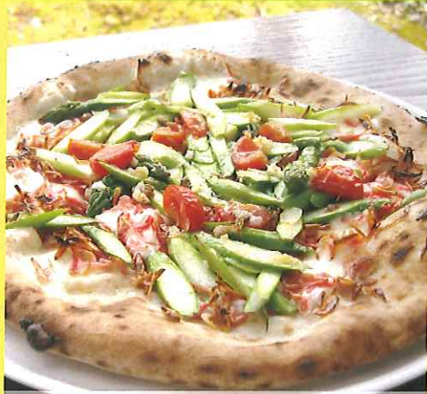
アスパラと桜エビのピッツァ ¥1,800(税別)