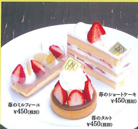
苺のショートケーキ ¥450(税別) 苺のタルト ¥450(税別) 苺のミルフィーユ ¥450(税別)