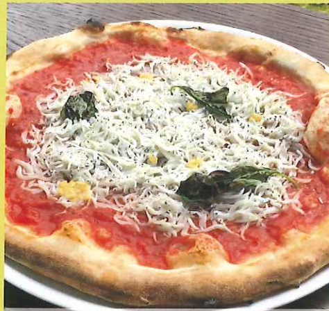
しらすのマリナラ ¥1,500(税別)