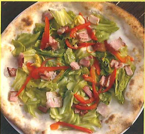
春キャベツとベーコンのピッツァ ¥1,700(税別)