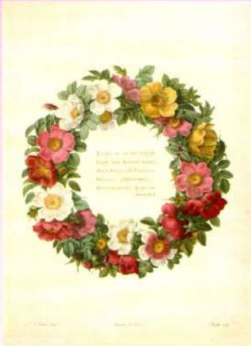
『バラ図譜』より 《リース》 点刻銅版画(多色刷り・手彩色補助) 1817年 コノサーズ・コレクション東京蔵

本展ではルドゥーテの代表作『バラ図譜(Les Roses)』(1817～24年刊行)に収録される版画全点に加えて、2点の肉筆画を紹介します。およそ170点の精緻なバラの作品をお楽しみください。