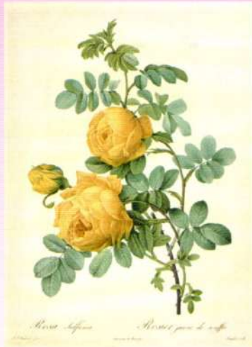
『バラ図譜』より 《ロサ・スルフレア》 点刻銅版画(多色刷り・手彩色補助) 1817年 コノサーズ・コレクション東京蔵