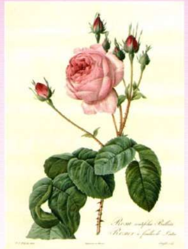
『バラ図譜』より 《ロサ・ケンティフォリア・プラータ》 点刻銅版画(多色刷り・手彩色補助) 1817年 コノサーズ・コレクション東京蔵