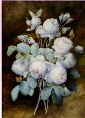
『肉筆画』 《バラのブーケ》 水彩・ヴェラム 1825年 コノサーズ・コレクション東京蔵