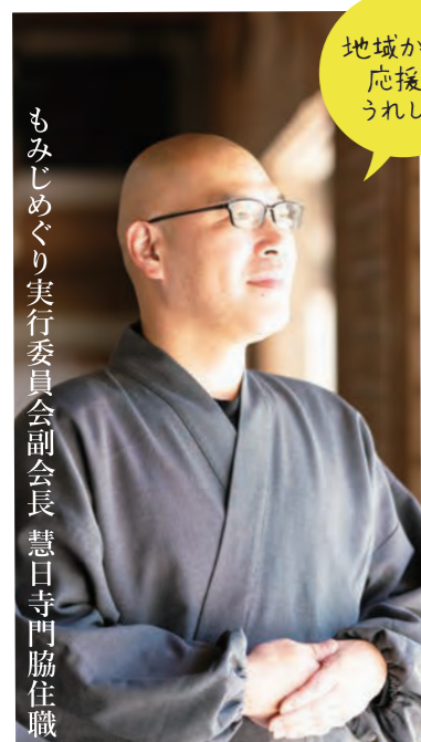
もみじめぐり実行委員会副会長 慧日寺門脇住職

「めぐり事業のおかげで、いつもは静かなお寺がこの時期ばかりは賑わいます。観光客の中にはもみじめぐりのリーフレットと御朱