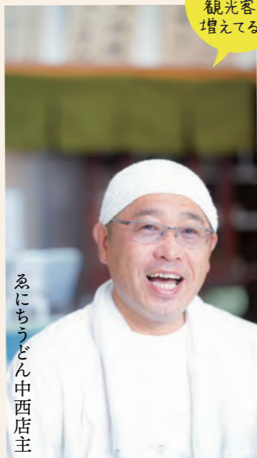
ゑにちうどん中西店主

「当地で開業し『ゑにちうどん』と命名することでお寺とワンセットで覚えてもらえる。慧日寺とは持ちつ持たれつ関係になっていると思う。それにめぐり事業を意識すれば一定数の来客が見込める。他業種とのコラボが生まれやすいプロジェクトだと思います。もちろん経済効果もありますよね」