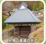
お福の産湯の井戸 ※興禅寺の境内にあります！