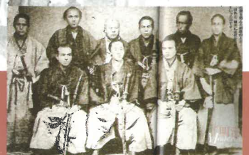
柏原藩最後の藩主

後援:・(一社)丹波市観光協会・㈱まちづくり柏原・柏原自治協議会・柏原観光まちづくりの会