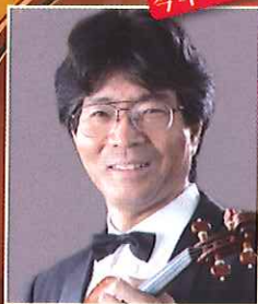
釋 伸司 (ヴァイオリン)