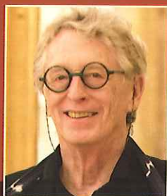
ノーマン・シェトラー (ピアノ)